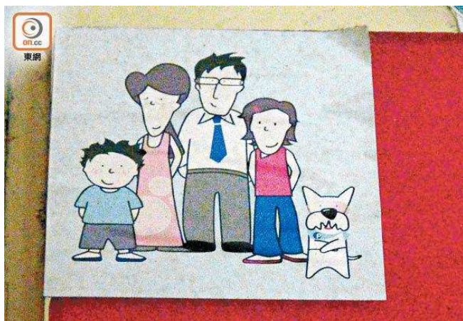
死者住所大門貼有一家四口的圖畫。